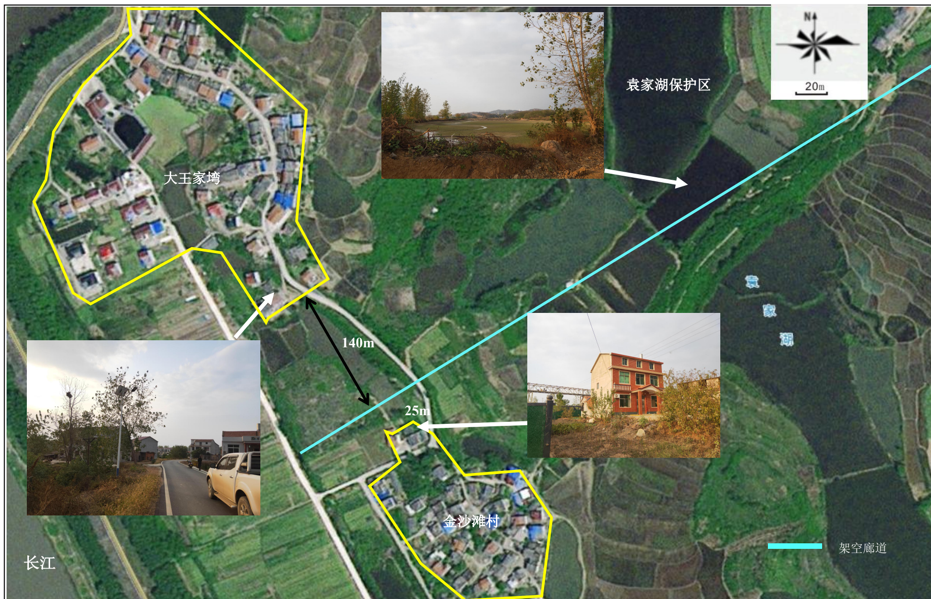
附图 3-5 项目周边环境图（终点段）