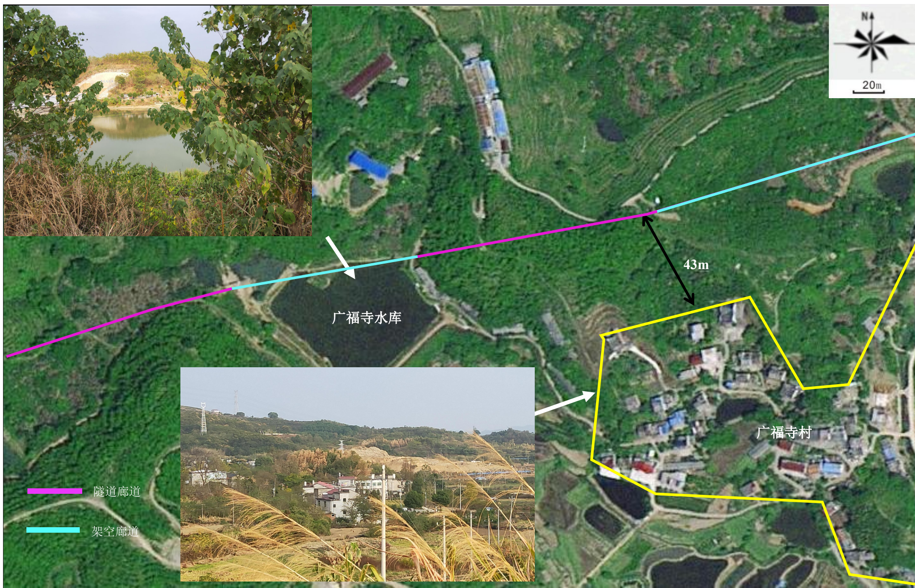
附图 3-3 项目周边环境图（经过水库段）