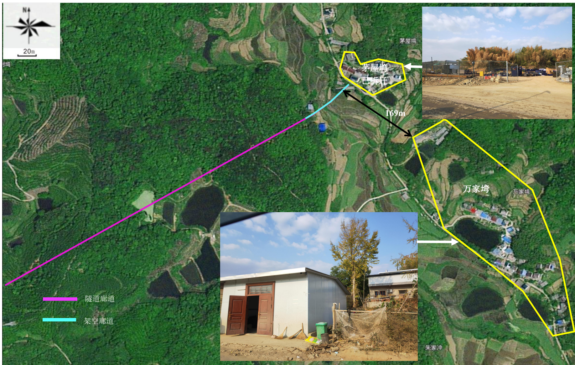
附图 3-1 项目周边环境图（起点段）