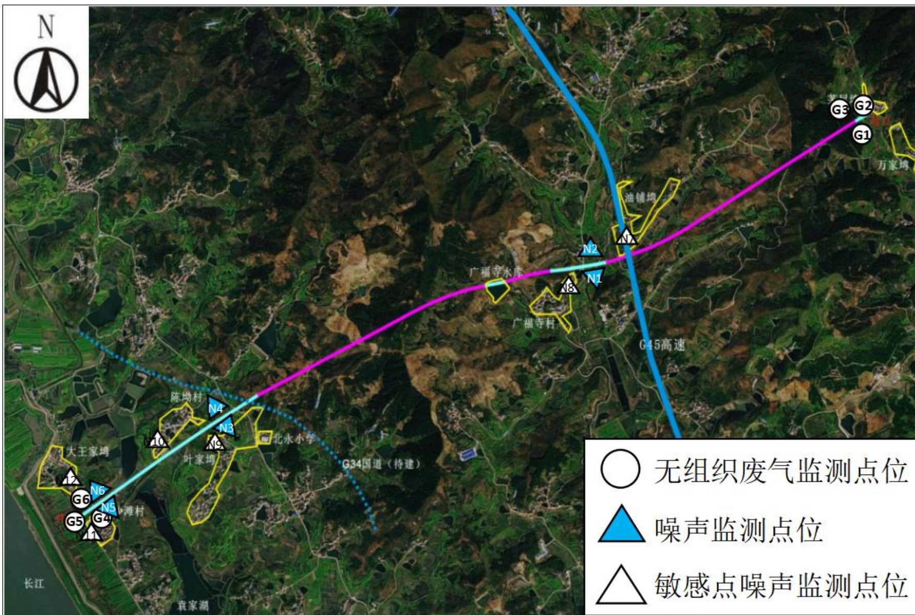
附图4 项目监测点位图