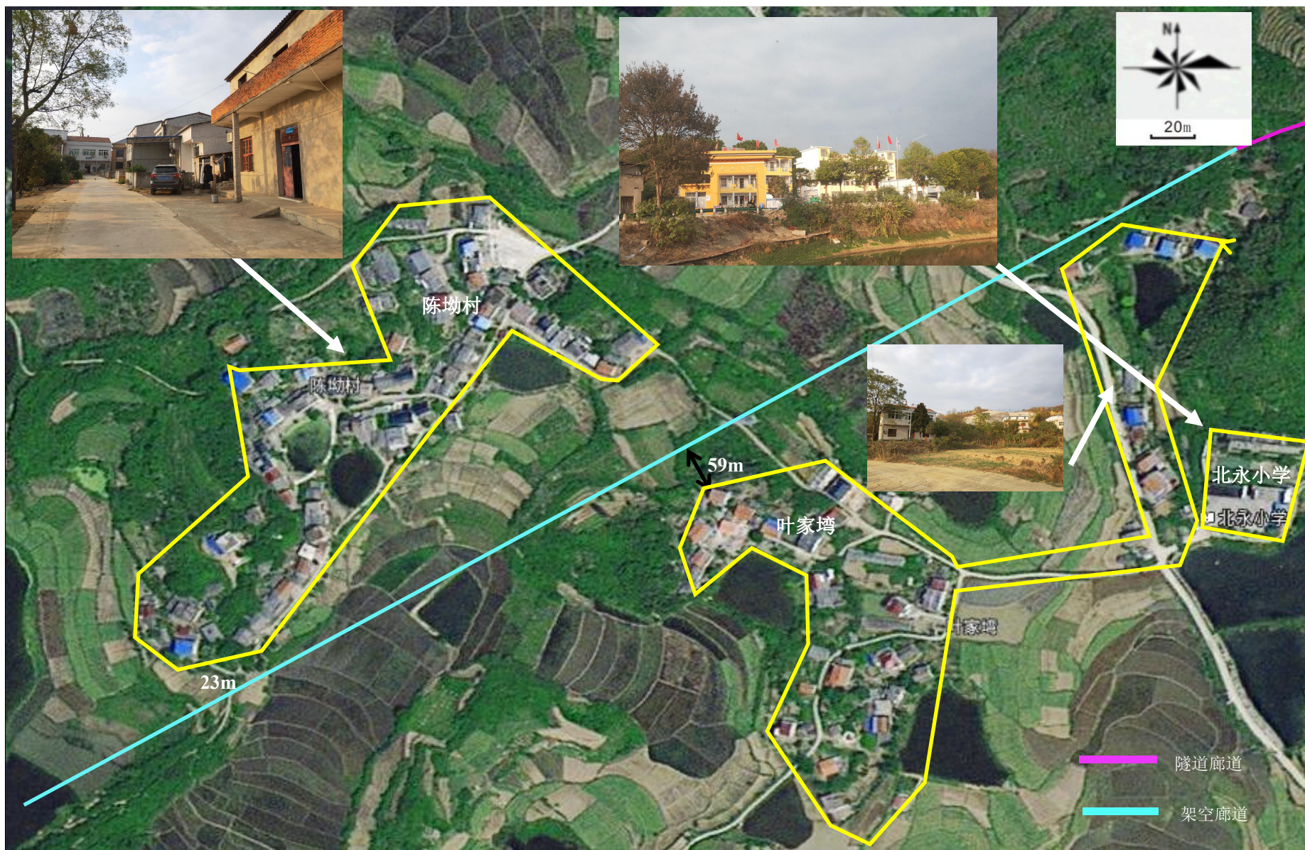
附图 3-4 项目周边环境图（居民密集段）