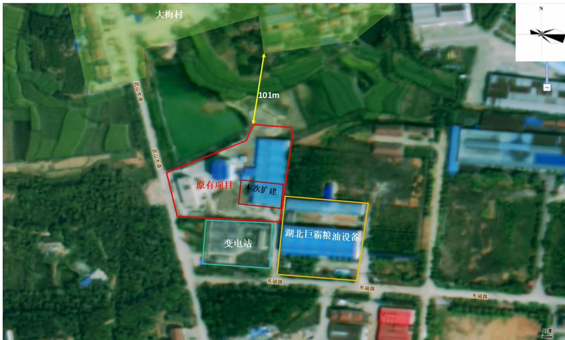
附图 2 项目周边环境关系示意图