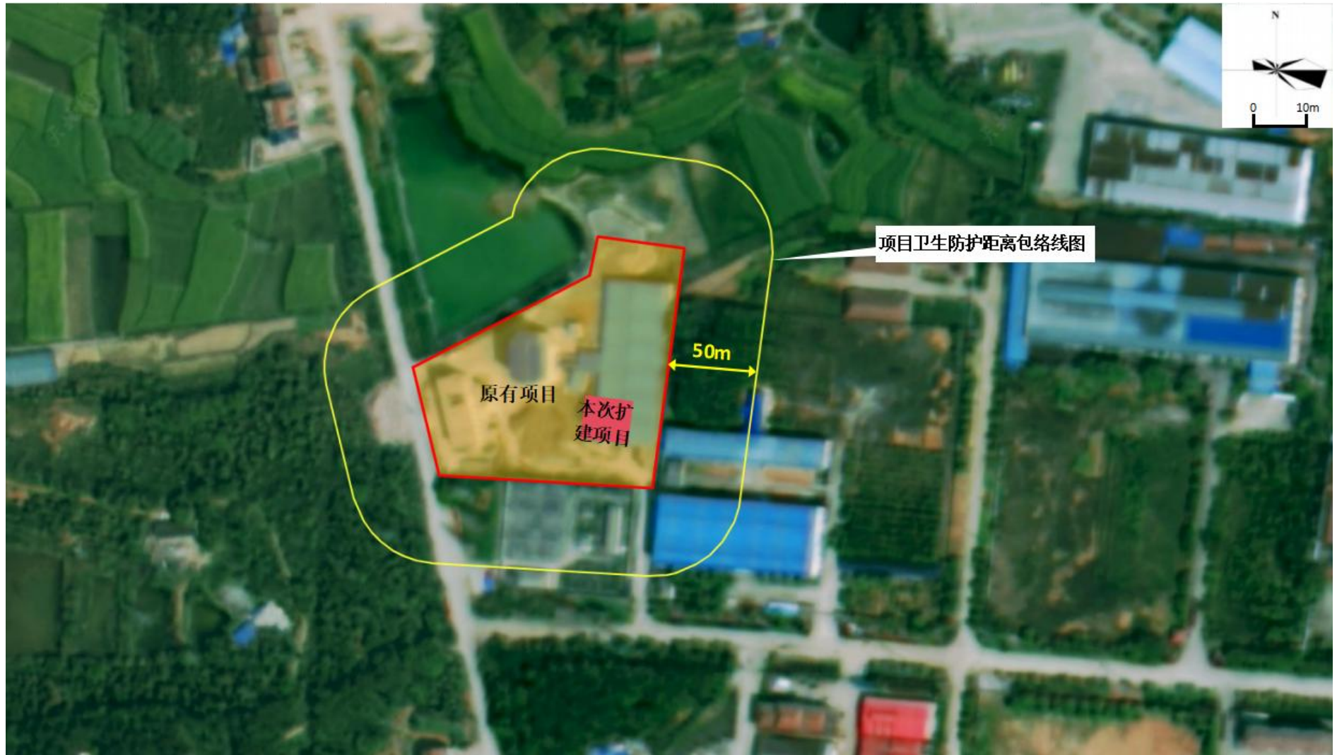
附图 5 项目卫生防护距离包络线图